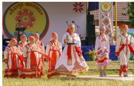
Республиканский праздник мордовской культуры «Валда Шинянь»