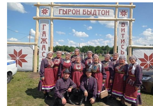
Республиканский праздник культуры кряшен «Питрау»