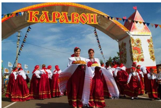
Русский народный праздник «Каравон»