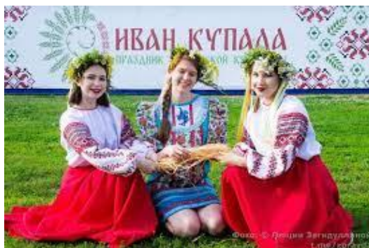
Республиканский праздник славянской культуры «Иван Купала»