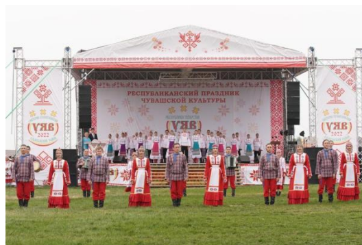
Республиканский праздник чувашской культуры «Уяв»