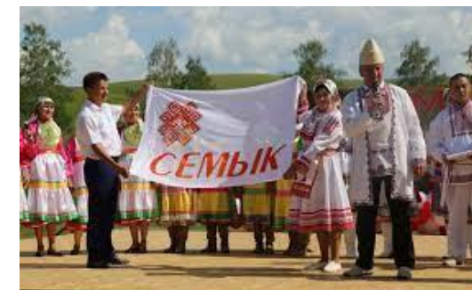
Республиканский праздник марийской культуры «Семык»